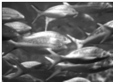
Paaiškėjo, kad žuvis geba logiškai mąstyti

Tačiau biologai pažymi, kad žuvų ir žmonių logika gerokai skiriasi. Nors žuvų mąstyme esama logikos užuomazgų, tai visai nereiškia, kad