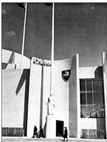
Pasaulinės parodos Niujorko Lietuvos paviljono

Vis dėlto pernelyg optimistinei gaidai nėra pagrindo. Vilniuje griebiamasi vieno ir kito grandiozinio projekto, kartais antraeilį ir net abejotinų iniciatyvų, o esminiai dalykai nustumiami į šoną arba išvis apeinami. Kaip vertinti faktą, kad 2009 m. Europos kultūros sostine tapsiantis Vilnius ligi šiol neturi kur eksponuoti XX a. nacionalinės Lietuvos dailės? Nacionalinė dailės galerijos statyba dešiniajame Neries krante vyksta vangiai. Gal kas sakys, kad netoli Kaunas, M. K. Čiurlionio muziejus, kur yra XX a. pabaigos lietuvių dailės ekspozicija. Skaudu, kad Lietuvos dailės muziejaus puikūs rinkiniai tebeguli saugyklose ir laukia nesulaukia laimingos valandos, kada bus eksponuojami perstatytuose Dailės galerijos rūmuose. Buvo metas, kai XX a. Lietuvos dailės so-