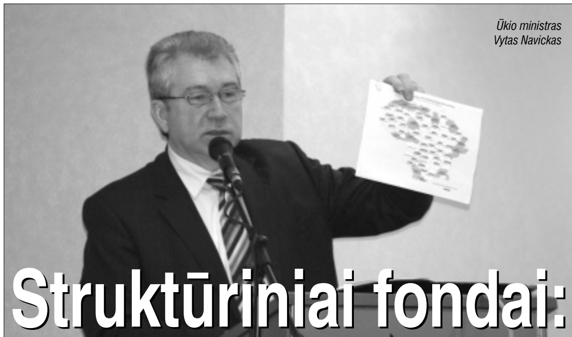
Ūkio ministras Vytas Navickas

Į šiuos klausimus mėgino atsakyti abu ministrai. Finansų ministras Zigmantas Balčytis priminė ES struktūrinės paramos strategijos kūrimo principus. Lietuvoje buvo įvertintos ilgalaikės valstybės strategijos, glaustame dokumente apibūdinta esama ekonominė šalies padėtis ir grėsmės, kylančios iš kaimyninių rinkų veiklos ir plėtros. Štai tame fone Lietuva ir mėgina padidinti savo konkurencingumą. Tam buvo priimtos 4 veiksmų programos (Paskutinė Seime buvo patvirtinta ES paramos programa, iš kurios dalį pinigų būtų galima panaudoti žmonių gebėjimams sukurti.) Tose programose buvo numatyta, kiek planuojama išsifaltuoti kelių, parengti aukštos kvalifikacijos darbuotojų, tarp jų ir mokslinio potencialo, kiek renovuoti mokyklų, pagaliau numatyta, ko siekiama didinant energetikos, ekonomikos veiksmingumą ir t. t.