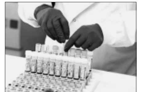
Jungtinėje Karalystėje vyksta intensyvūs meticilinui atsparaus auksinio stafilokoko (MRSA) tyrimai