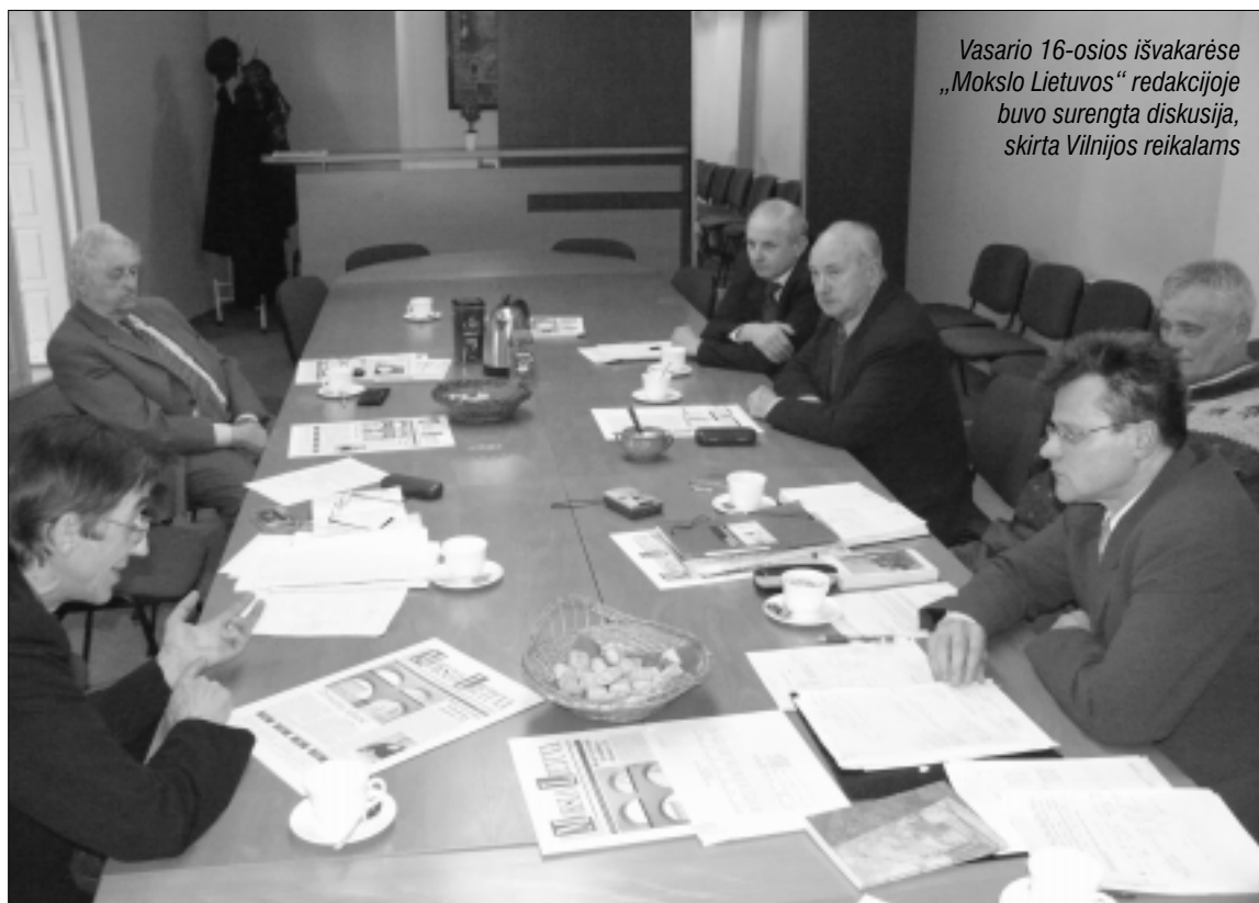
Vasario 16-osios išvakarėse „Mokslo Lietuvos“ redakcijoje buvo surengta diskusija, skirta Vilnijos reikalams

LR Prezidentas ir Vyriausybės vadovas privalėjo laikytis Lietuvos įstatymų. Vilnijos draugija tuo klausimu yra padariusi pareiškimą. Bet kartais politiniai motyvai nulemia net aukščiausių pareigūnų veiksmus. Lenkija yra mūsų strateginis partneris, nuo Solidarumo laikų taip pat ir Vilnijos draugija palaikė visus Lenkijos reikalus. Ir dabar palaikome. Bet toje Armijos Krajos ir Lietuvos vietinės rinktinės deklaracijoje yra dalykų, dėl kurių mūsų šalių nuomonės nesutampa. Tai liečia tik Lietuvos teritoriją.