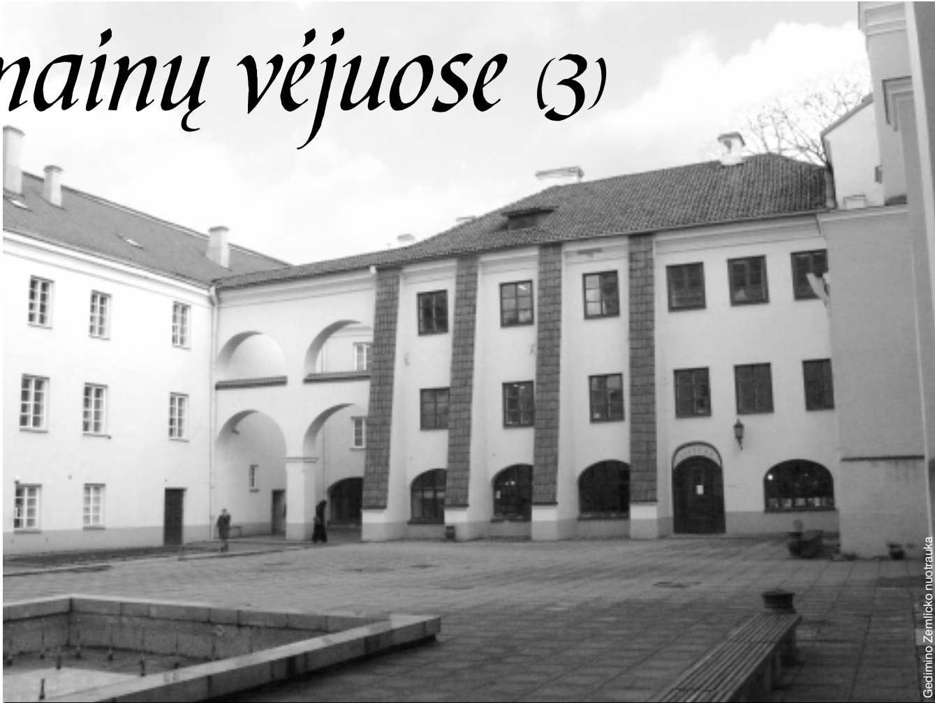
Su žiemos šalčiais Vilniaus universiteto Filologijos fakultete papūtė pertvarkos vėjai

Žinote, kažin, ar tai pagrindinė euforijos priežastis. Euforija nuo stebuklo – nepriklausomybės atgavimo. O visokie ideologiniai pančiai, Vakarų universitetai, ambasados ar gali kelti kokias euforijas. Nereikia