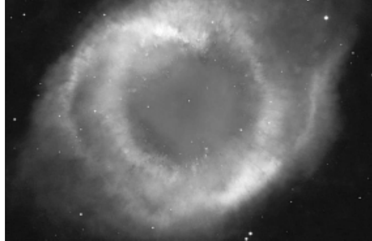
Planetiškas ūkas NGC 7293 Vandenio žvaigždyno. Jo centre esanti mirusi žvaigždė – baltoji nykštukė, apšviečia savo nusimestus viršutinius sluoksnius. Galbūt taip Visatoje atrodys mūsų Saulė...

tusios raudonosios milžinės (tai greisia mūsų Merkurijui ir Venerai), arba jos plėtimosi metu išstumiamos iš savo orbitų į tolimą kosminę erdvę (tokia lemtis laukia tolimesnių Saulės sistemos planetų ir asteroidų).