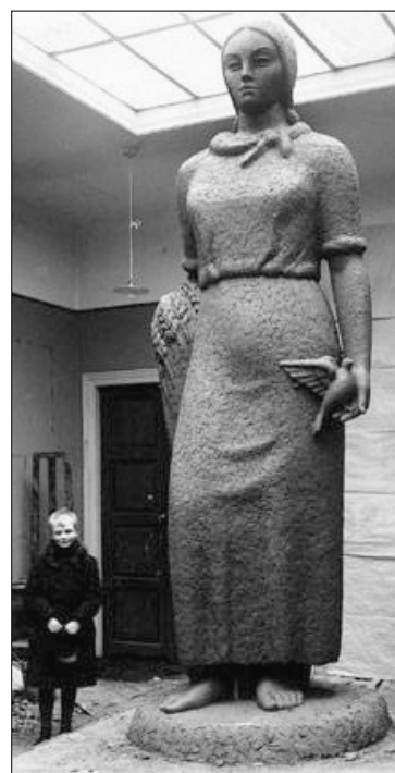
1939 m. Pasaulinėje parodoje Niujorke lankytojus prie Lietuvos paviljono pasitiko Juozo Mikėno skulptūra „Lietuva“.

Po karo P. Kalpoko paveikslas Signatarai buvo perkeltas į Lietuvos