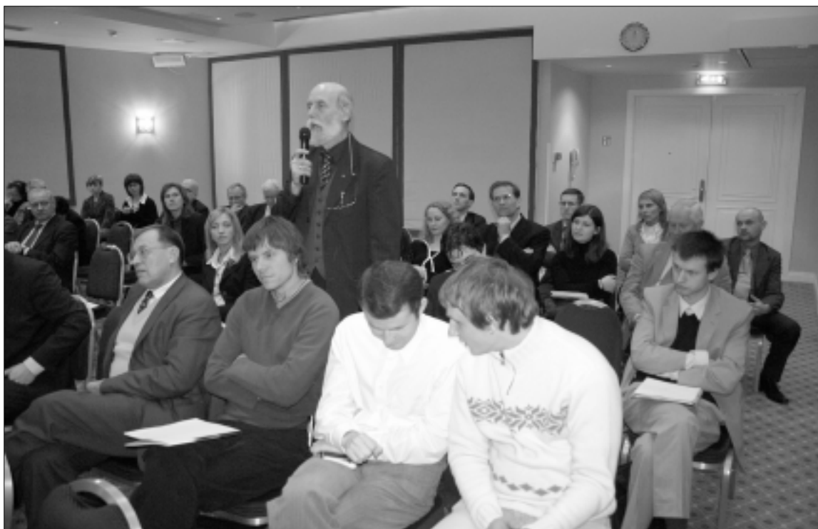
Apitariami Europos Sąjungos struktūrinių fondų įsisavinimo klausimai